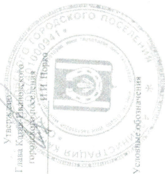
Схема асфальтирования дворовой территории ул. Дмитрия Тараканова, 37